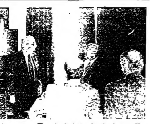
بجسلي في مبنى بلدية طرابلس